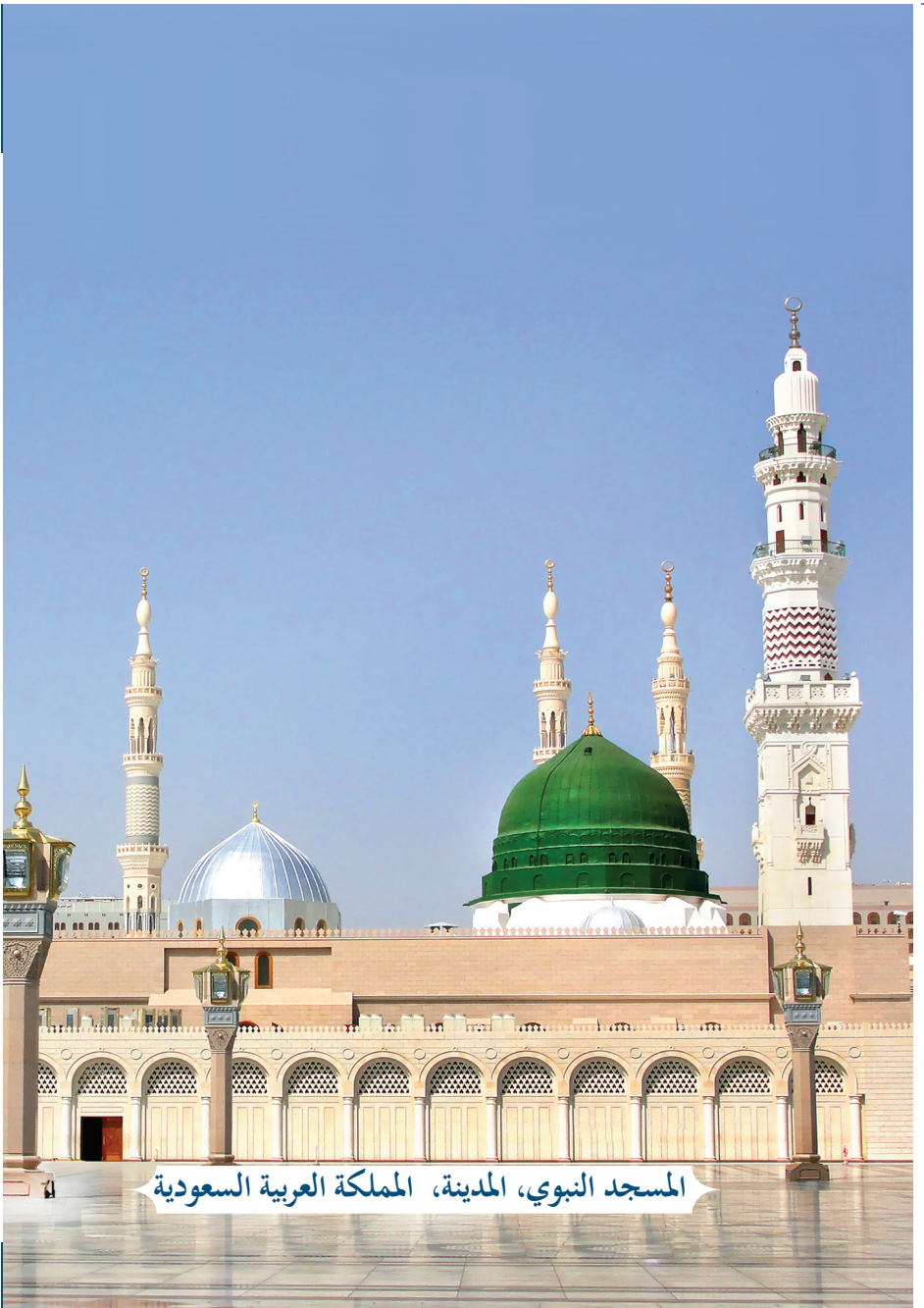
المسجد النبوي، المدينة، المملكة العربية السعودية