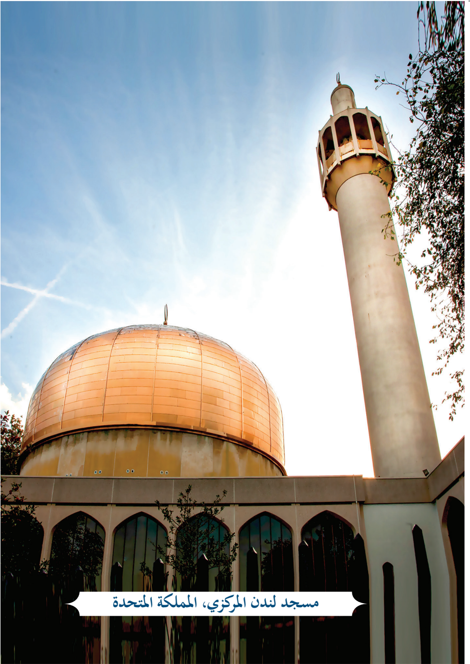
مسجد لندن المركزي، المملكة المتحدة