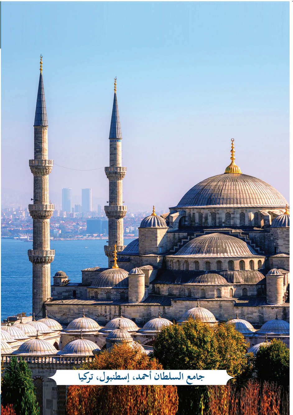
جامع السلطان أحمد، إسطنبول، تركيا